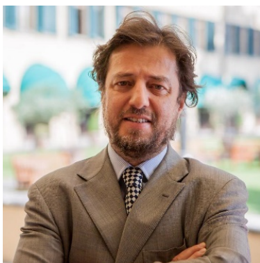
Miguel Poiars Maduro